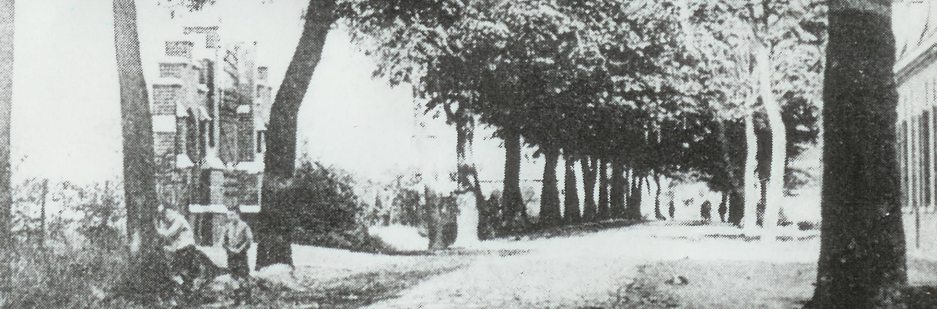
Het uitgewiste traditionele landschap