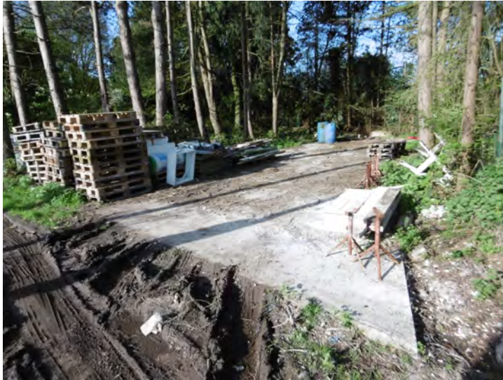
Foto: In een bos langs een autosnelweg start stiekem de bouw van een woning die verhuurd zou worden aan goedkope, buitenlandse werkkrachten. De politie merkt de bouw op en er komt een stakingsbevel. De berekende schender, gekend in andere dossiers, wachtte met het herstel tot vlak vòòr het parket zou dagvaarden. Het stakingsbevel was goedkoop; het vervolgtraject duur: de handhavingscel werkte tien uur aan dit dossier, voor de schender overging tot herstel. Dat is typisch bij berekende schenders. Zij kennen de wetgeving en procedures erg goed.

Herstel kan ook bestaan uit regulariseren of minnelijk schikken . Zo had men in onderstaand voorbeeld heel wat bijgebouwen geplaatst en terrein verhard, zonder vergunning. Een deel werd geregulariseerd; voor de rest werd een minnelijke schikking aangevraagd.