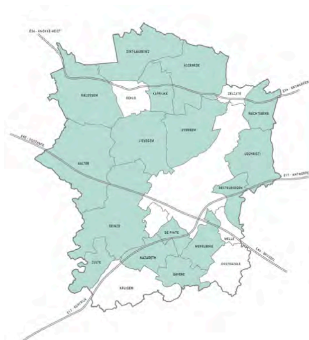
Kaart: zestien gemeenten rond Gent doen beroep op de intergemeentelijke handhavingscel (stand d.d. 21 februari 2019, na enkele fusies op 1 januari 2019).

Sinds januari 2019 doet ook de gemeente Destelbergen een beroep op de intergemeentelijke handhavingscel. Dat brengt ons tot onderstaande kaart.