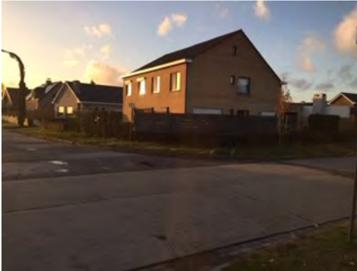
Foto: Een hoge, ondoorzichtige afsluiting op de hoek van een straat, tegen de verkavelingsvoorschriften in, en zonder vergunning. Die belemmert het zicht voor het verkeer en is een doorn in het oog voor burens die zich wel aan de voorschriften houden.

Een typisch klein dossier is dat waarbij een onwetende, nieuwe eigenaar een constructie zet zonder vergunning, die gemakkelijk is weg te halen. Aanmanen volstaat dan.