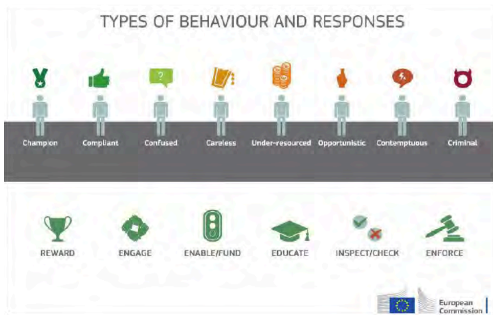
Figuur: types schenders en de beste aanpak bij het handhaven.

In praktijk komen de onwetenden en opportunisten het meest voor. Een typisch handhavingstraject is dan: