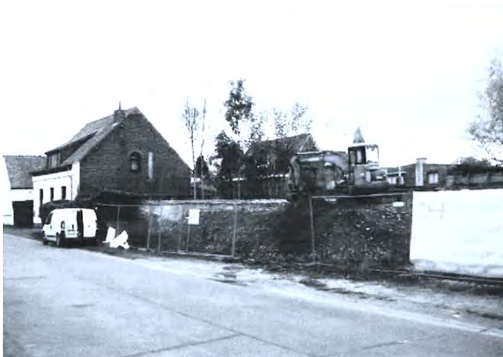
Foto boven: Een aannemer mengt de resten van een afgebroken hoeve met aangevoerde grond van onbekende oorsprong. Een buur meldt stoffinder en ontdekt dat het stof asbest bevat. Aanmanen helpt niet. Onder druk van de eigenaar van het terrein, verwijdert de aannemer alles. De wettelijk verplichte transportdocumenten ontbreken...

In een minderheid van de gevallen hebben we te maken met criminelen, die net geld verdienen door regels te schenden. Inlichten en aanmanen zijn dan tijdsverlies. Wat wel werkt: het parket inlichten, een dwangsom opleggen, verzegelen en/of herstellen op hun kosten .