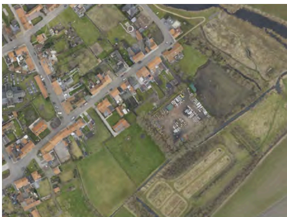
Foto: Oude steenkapperij (centraal op de foto) tussen groengebied (rechts en onder) en een woonzone (links en boven). Hinder voor de omwonenden wegnemen, én de rechten van de uitbater vrijwaren: een complexe oefening.

We bevelen gemeenten alvast aan om het vertrouwen te versterken van klagers én schenders in het gemeentebestuur. Door binnenkomende meldingen professioneel op te volgen, zorgen zij daarvoor.