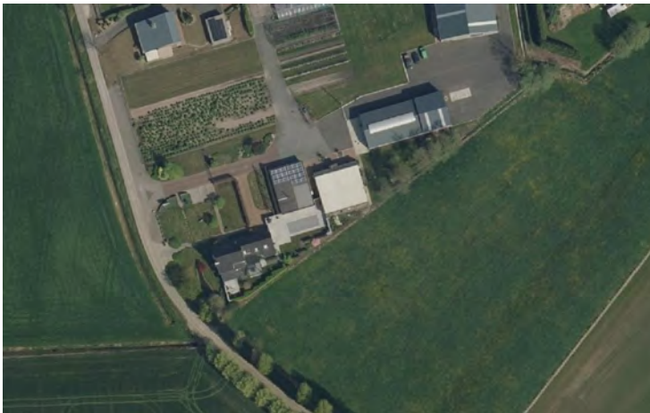
Foto: Bijgebouwen en verharding in agrarisch gebied. Het geheel past binnen een para-agrarische activiteit en oogt bijzonder mooi. Het werd echter geplaatst zonder vergunningsaanvraag, waardoor burens noch overheid inspraak kregen. Die kwam er wel bij de regularisatievergunning. Voor het deel dat de goede ruimtelijke ordening schaadt, werd een minnelijke schikking voorgesteld.

Herstel kan ook bestaan uit regulariseren of minnelijk schikken . Zo had men in onderstaand voorbeeld heel wat bijgebouwen geplaatst en terrein verhard, zonder vergunning. Een deel werd geregulariseerd; voor de rest werd een minnelijke schikking aangevraagd.